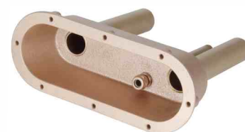
puszka włącznika PN 375170