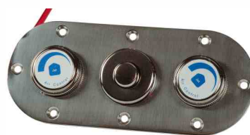
włącznik PN 3-funkcyjny 375175